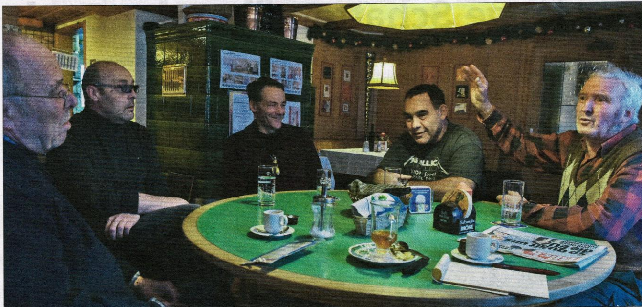
«Mir Ur-Ramser wüssed da scho»: Die Hülpe-trütsch-Fachleute treffen sich am Samstagvormittag im Hirschen.

auf der Lauer liege. Der gesamte Stammtisch nickt zustimmend.