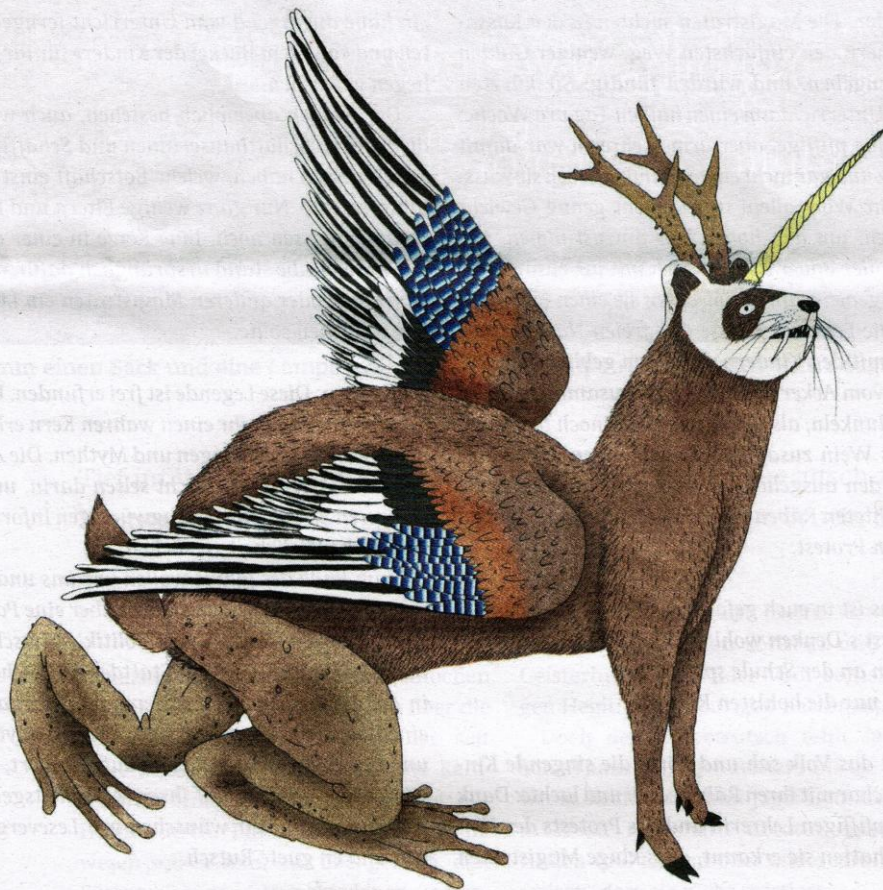
Trucchius hylpae major M. (Fig.1.)

Gestatten: der Hülpetrüttsch. Er ist ein mythisches Fabelwesen, das im Wald bei Ramsen sein Unwesen treiben soll. Wo und wie kann man ihn fangen? Und sieht er wirklich so aus wie auf unserer Illustration? Mit dieser Dossiernummer nehmen wir regionale Mythen und Legenden unter die Lupe. Dabei begegnen uns Glocken, Bomben, Ritter und Rockstars.